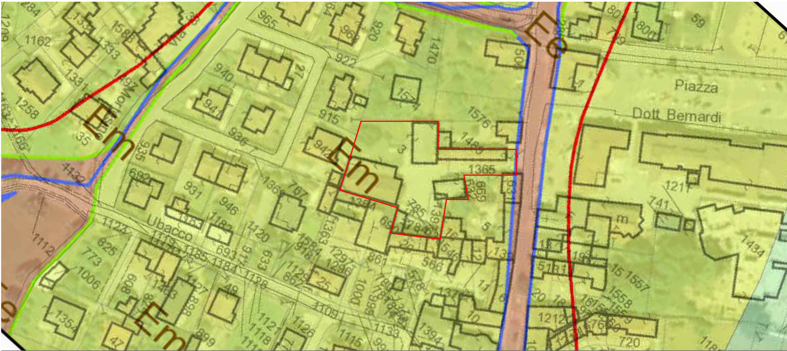
Classe di pericolosità geomorfologica 2: porzioni di territorio nelle quali le condizioni di moderata pericolosità geomorfologica Scala 1:1000