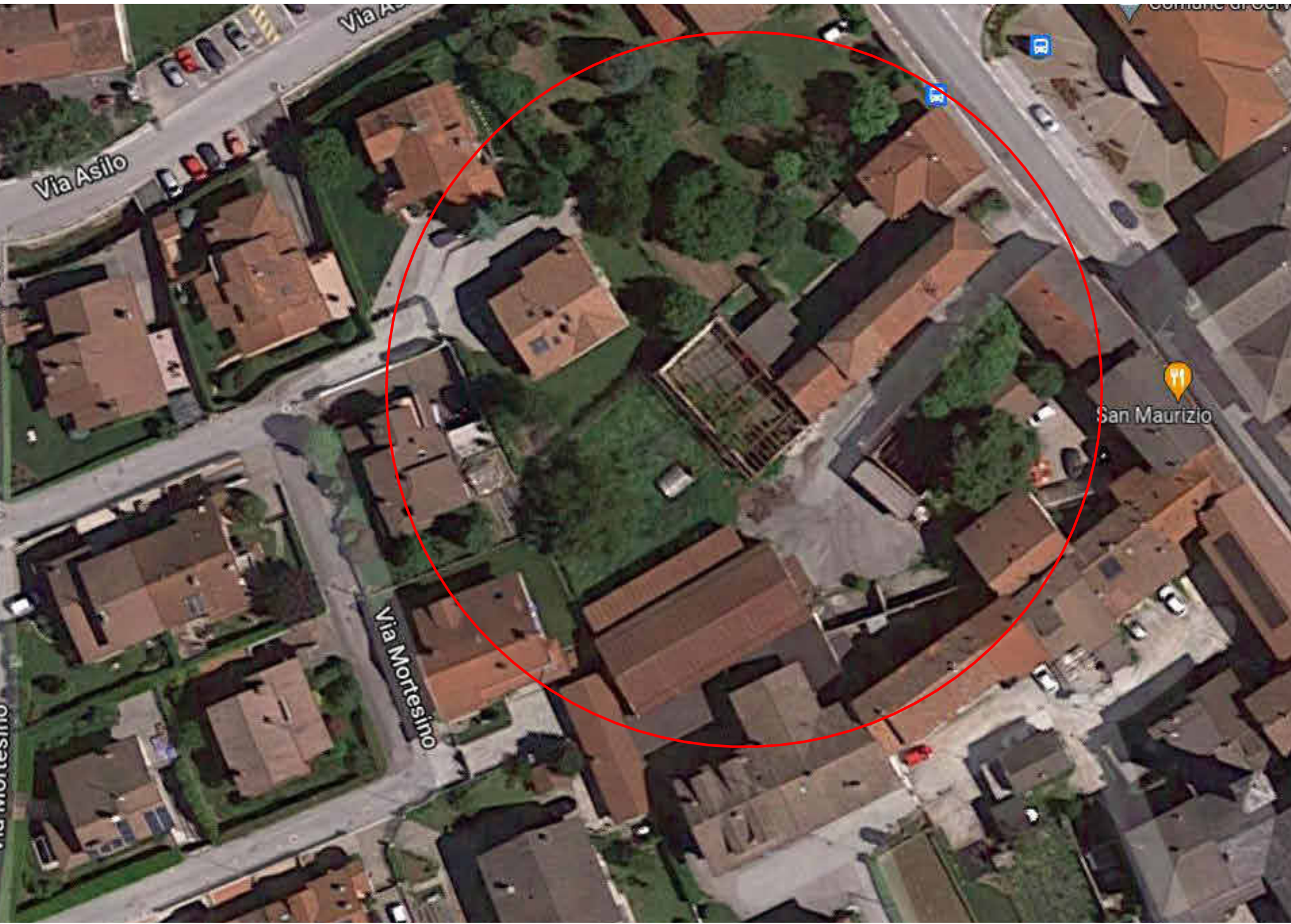
Vista aerea dell'area oggetto di intervento