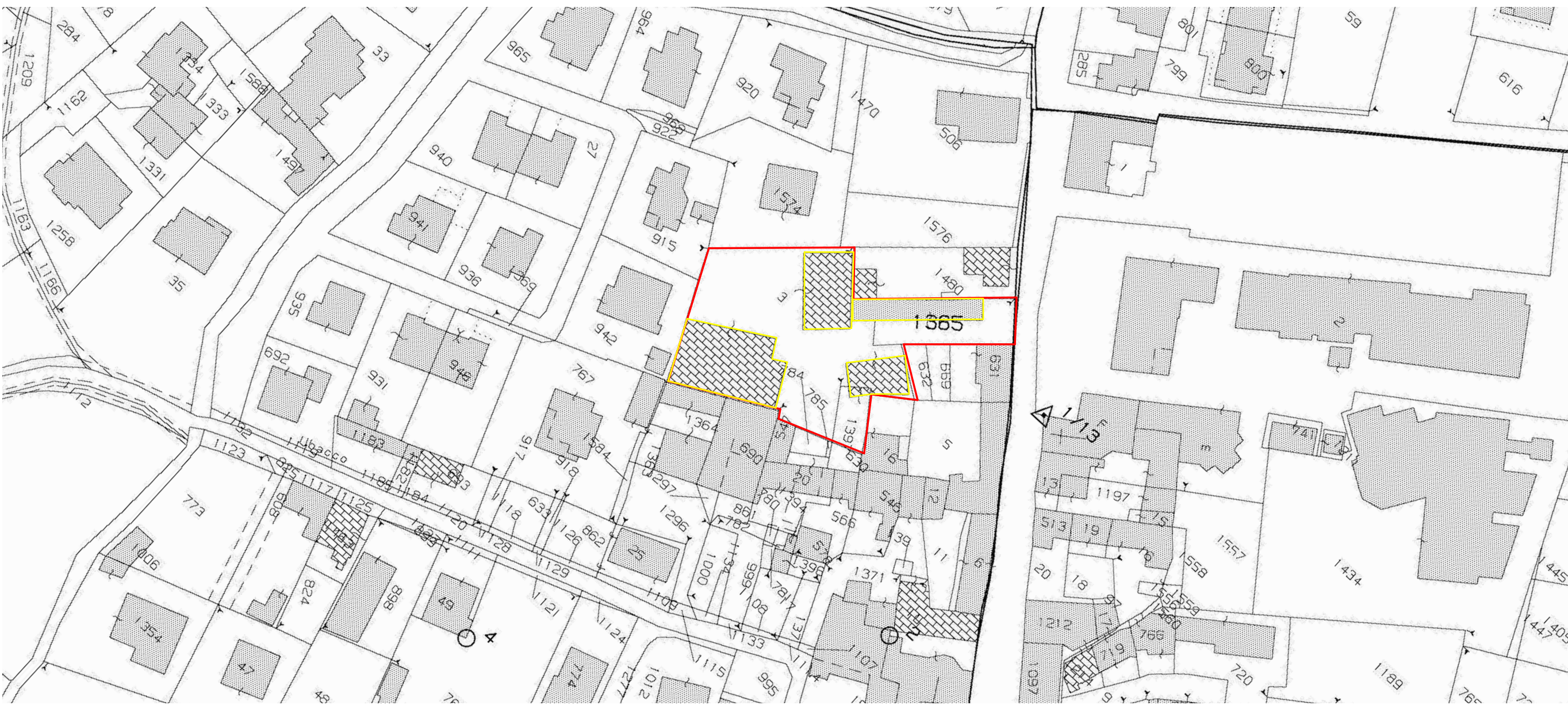
Catasto fabbricati: Foglio 17, Mappali 3, 1365 Scala 1:1000